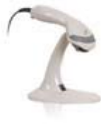
MS9540 Voyager CG